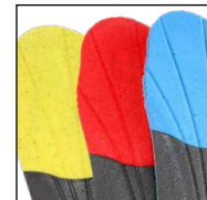
Vario Wide Fit System